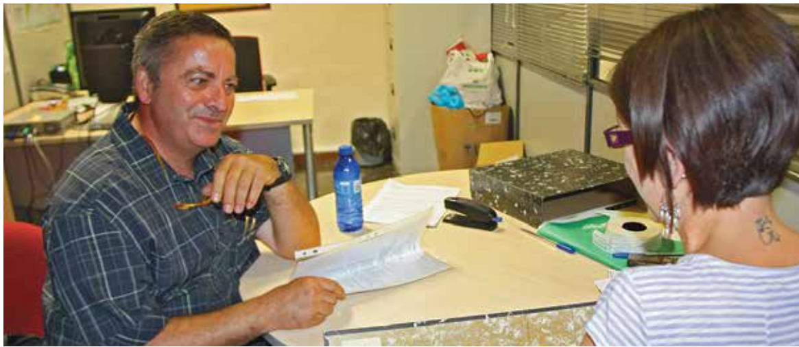
Uno de los candidatos durante la entrevista