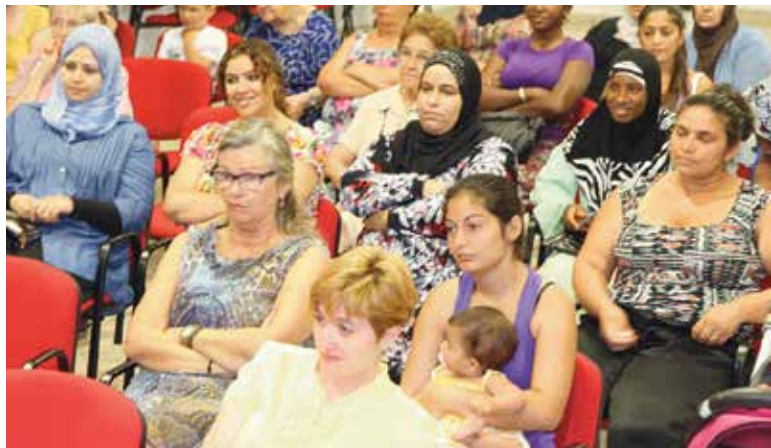
Imagen del salón de actos durante la clausura del proyecto

Desde la Concejalía se considera que "para apoyar la integración y mejorar la convivencia y el respeto es necesario conocer y aceptar las diferencias entre culturas". También para el Ayuntamiento ha sido