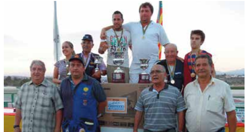
Foto de familia de los galardonados

La próxima gran cita del calendario deportivo de Fedecat en España será el Campeonato de Europa de Palomas a Brazo que tendrá lugar, el 23 de septiembre, en Cheste (Valencia).