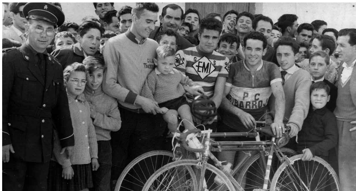
Ciclistas a las puertas del antiguo casino de la plaza

Además de este material multimedia, Paternateca realizará entrevistas a vecinos de la población que tengan anécdotas históricas sobre el pueblo, que hayan participado activamente en sus fiestas, o pertenecido a asociaciones culturales y deportivas del municipio a lo largo de su vida. Estos testimonios serán de un alto valor con el paso de los años ya que