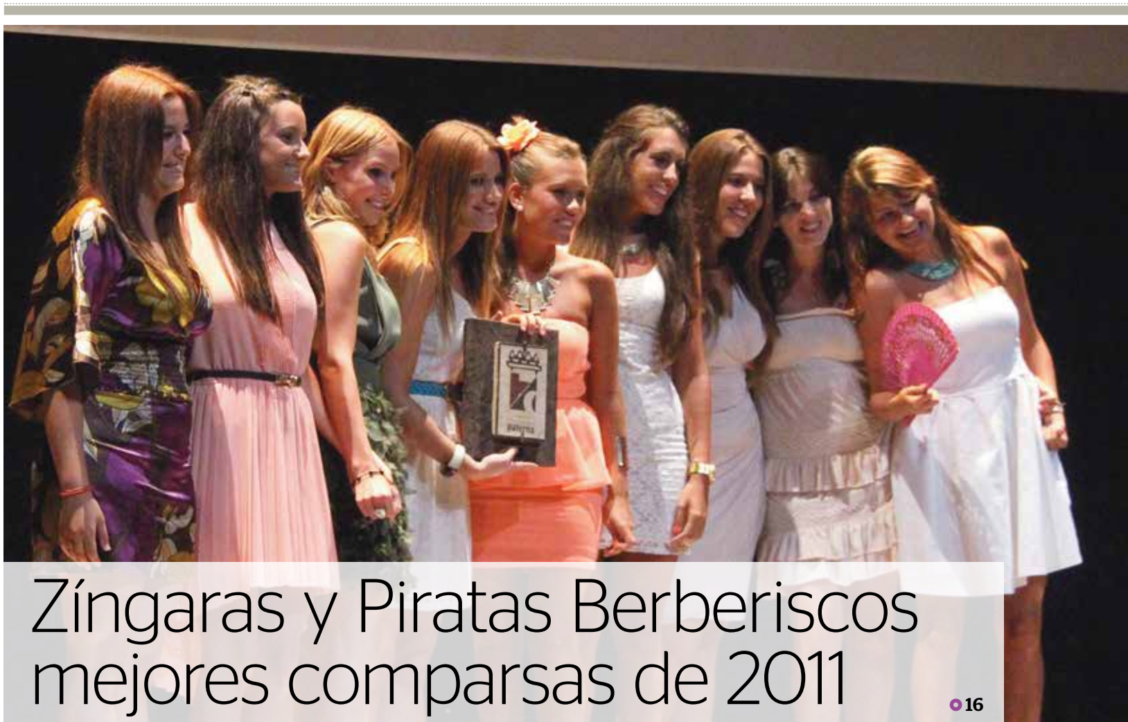
Zíngaras y Piratas Berberiscos mejores comparsas de 2011