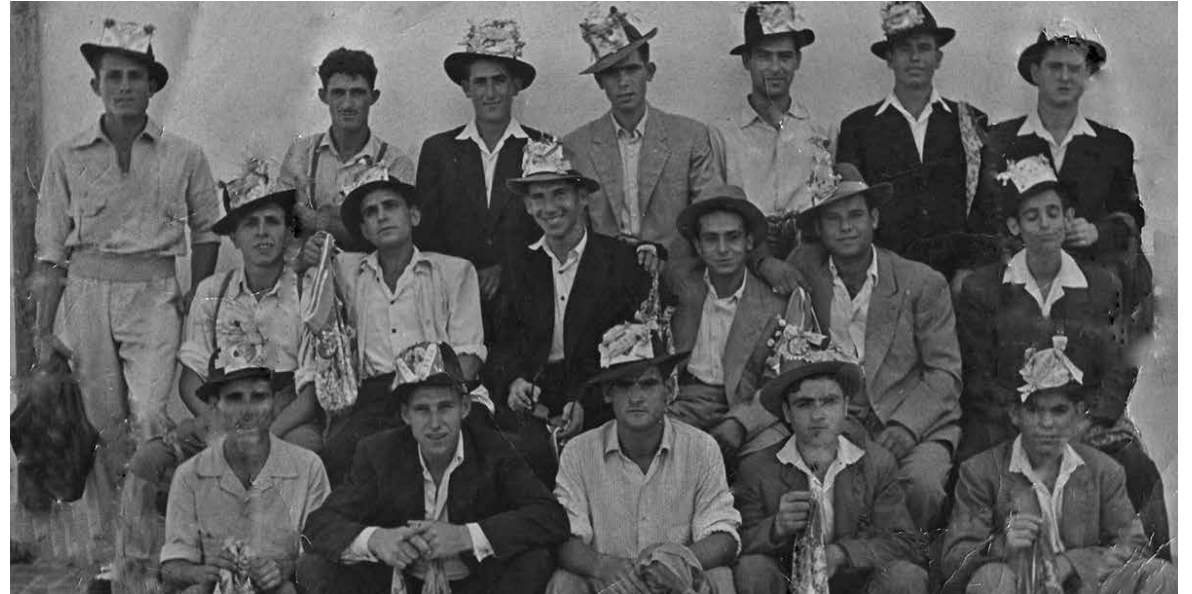
Grupo de quintos de Paterna nacidos en 1929