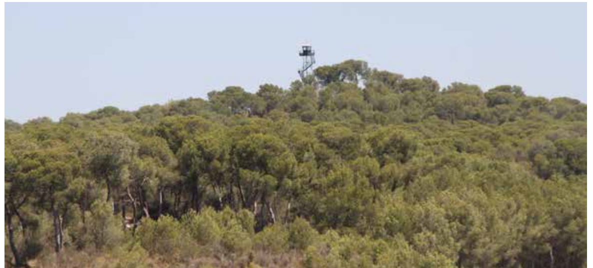
Imagen de la Torre de Vigilancia desde el corazón de La Vallesa