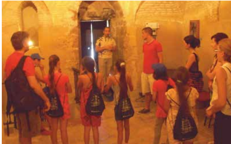
Los alumnos durante la visita a la Torre

La Fundación Secretariado Gitano, entidad social que presta servicios para el desarrollo de la comunidad gitana, actúa tanto a nivel nacional como europeo desde el año 2001. Su misión es la