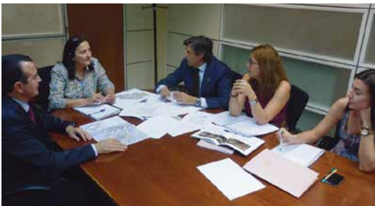
Agustí y Palma durante la reunión

El alcalde de Paterna consideró que "se trata de un proyecto importante para el futuro desarrollo de Paterna, enfocado completamente al objetivo de dar impulso a la economía local, atraer inversiones y crear puestos de trabajo. Por este motivo esperamos contar con la colaboración de todas las administraciones".