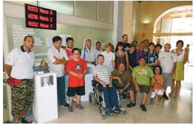
Alumnos, familiares y profesores en la presentación