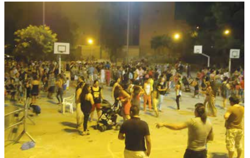
Imagen de las Fiestas Populares en el barrio de la Coma