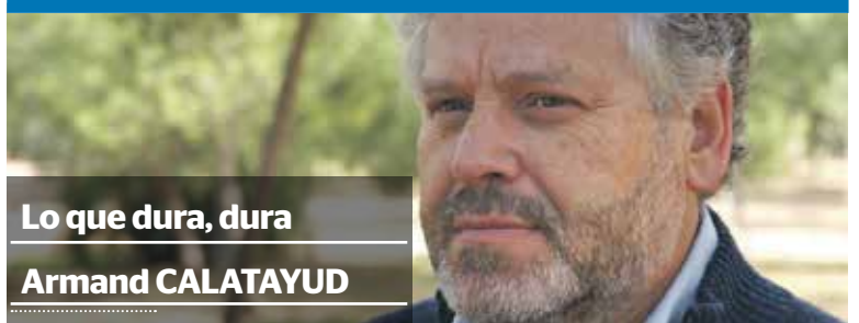
Lo que dura, dura

El portavoz de Esquerra Unida en el Ayuntamiento de Paterna, justificó su decisión afirmando que “como cargos públicos, que recibimos nuestra retribución de los presupuestos públicos, debemos estar con quienes sufrirán un nuevo recorte salarial, a pesar de nuestro desacuerdo con estas medidas propuestas por el Gobierno”.