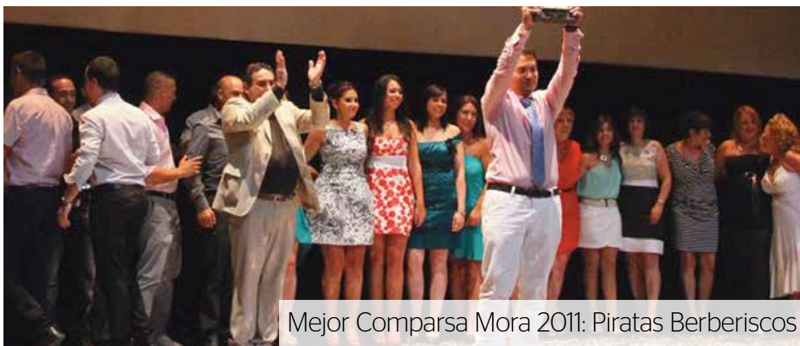
Mejor Comparsa Mora 2011: Piratas Berberiscos