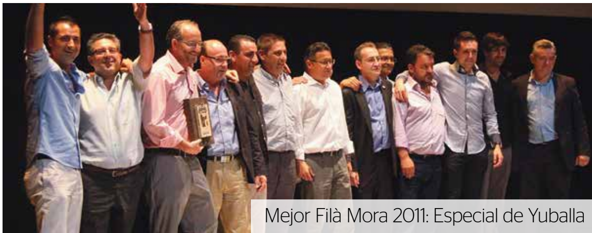
Mejor Filà Mora 2011: Especial de Yuballa