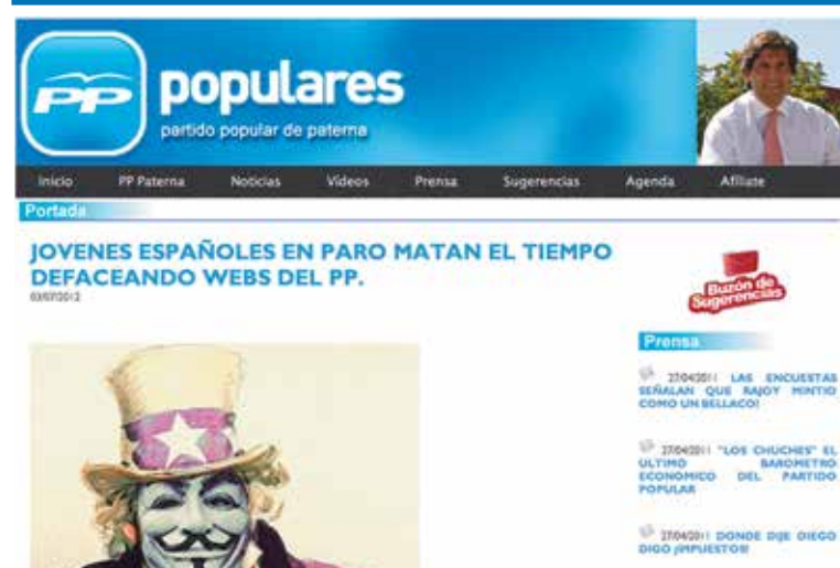
Captura de pantalla de la web "defaceada"