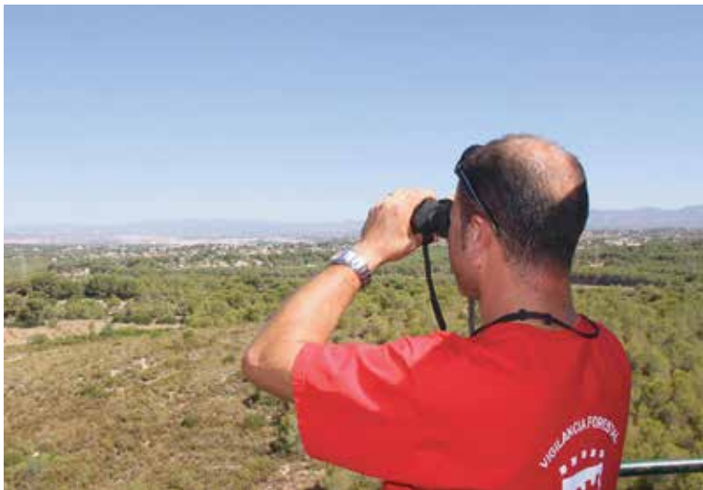
Uno de los vigilantes, desde la torre de las Terrerías

rales como el de Andilla o Cortes de Pallás. En Paterna, las zonas urbanizadas susceptibles de ignición son sobre todo La Canyada, la urbanización La Pinaeta y el sudoeste del Parque Tecnológico. Por tanto, se recomienda no abandonar en el bosque botellas ni objetos de cristal; apagar bien las cerillas y cigarros; encender fuego solamente en lugares autorizados e informar al 112 si se avista un incendio forestal o columna de humo dentro del monte.