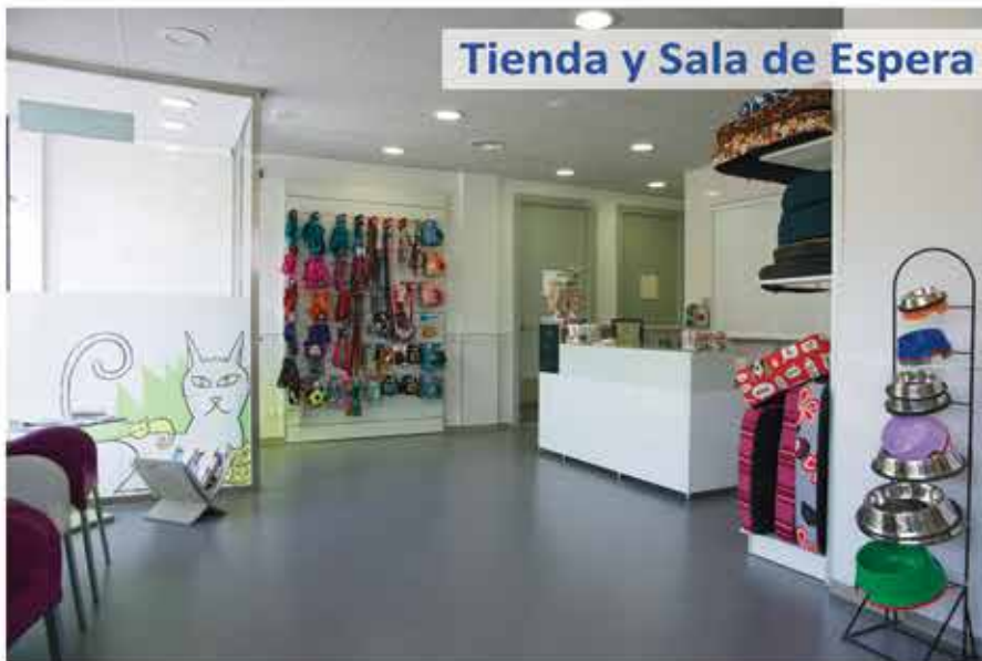
Tienda y Sala de Espera