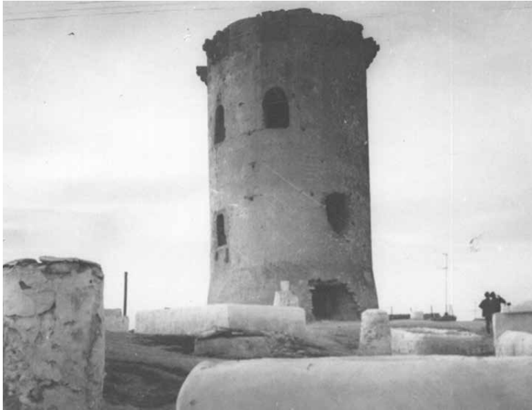
Imagen antigua de la Torre