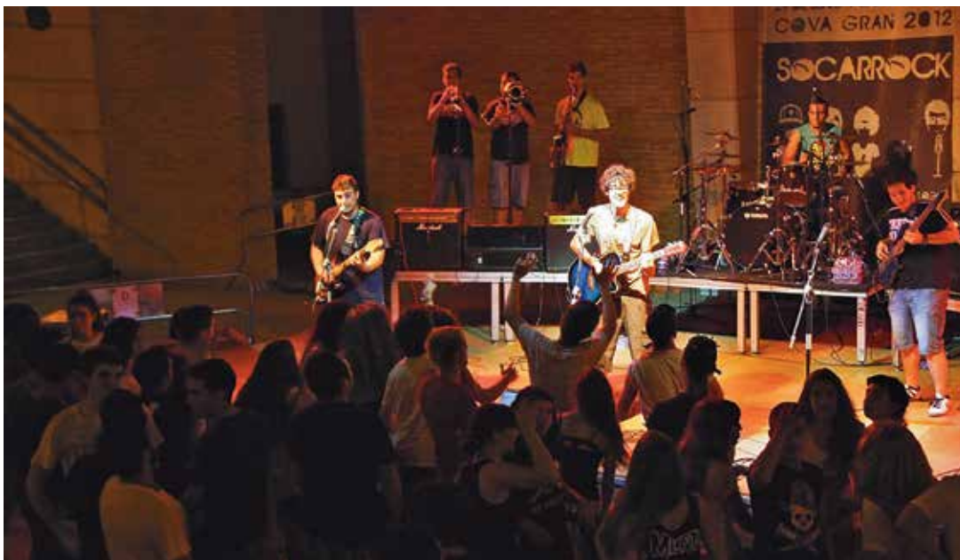
Actuación de La Caravana en el Festival Socarrock