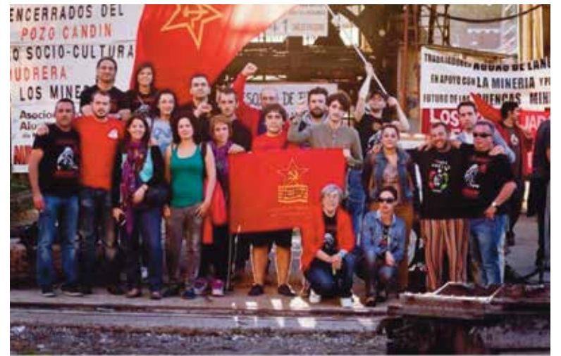
Integrantes de la Brigada Solidaria

El día 7 de julio por la mañana miembros del PCE de Langreo y de la Brigada organizada por el PCE de Paterna se desplazaron hasta el Pozo Candín, para participar en la asamblea que cada sábado por la