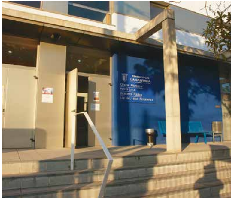
Imagen del Centro Social de La Canyada

Estas modificaciones se producen motivadas por la minoración del horario de conserjería, que suponía el cierre de los centros sociales durante los fines de semana por motivos económicos. Con el objetivo de que las Juntas de Barrio y Asociaciones pudieran seguir desarrollando eventos como exposiciones o ensayos corales que son