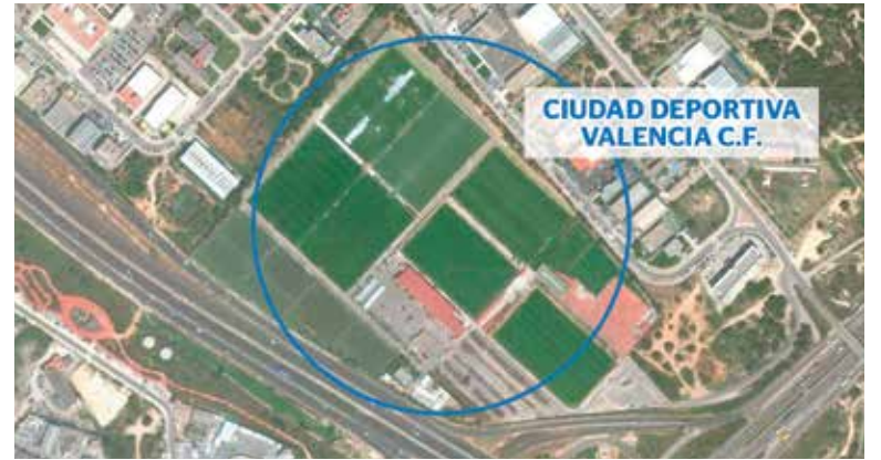
Vista aérea de la Ciudad Deportiva del Valencia CF en Paterna PAD

Equipo de Gobierno indicando que “pese a que nunca ha sido nuestro deseo que el Valencia CF abandone Paterna, no vamos a ir en contra de sus intereses y hemos aprobado el inicio del expediente porque supone en primer lugar una actuación beneficiosa para el municipio y por otro lado ayudar al Valencia CF, que es un baluarte económico y deportivo de la Comunidad y que se encuentra en un momento muy delicado”.