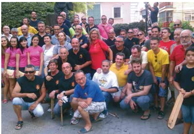
Homenaje a los tiradores difuntos

Además de los actos pirotécnicos del día de la Cordà, Paterna celebró distintos eventos relacionados con la pólvora, como el “Homenaje a los Tiradores Difuntos”, el “Homenatge als homes grans”, la masclètà manual o el correfoc, entre otros. Actos que, bajo la organización de Interpeñas, han gozado de una amplia participación por parte de los vecinos que han demostrado, un año más, su pasión por la pólvora.