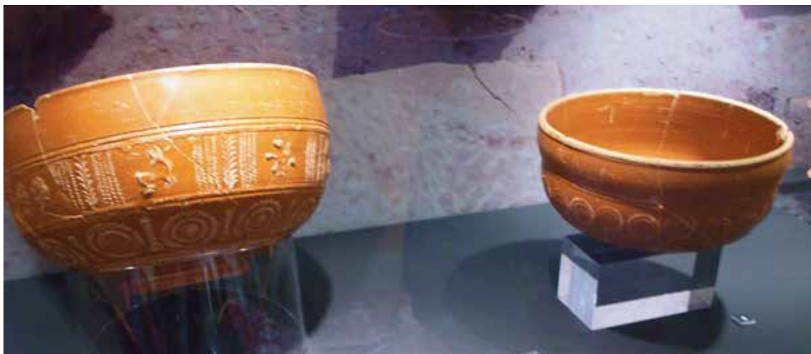
Foto de la exposición