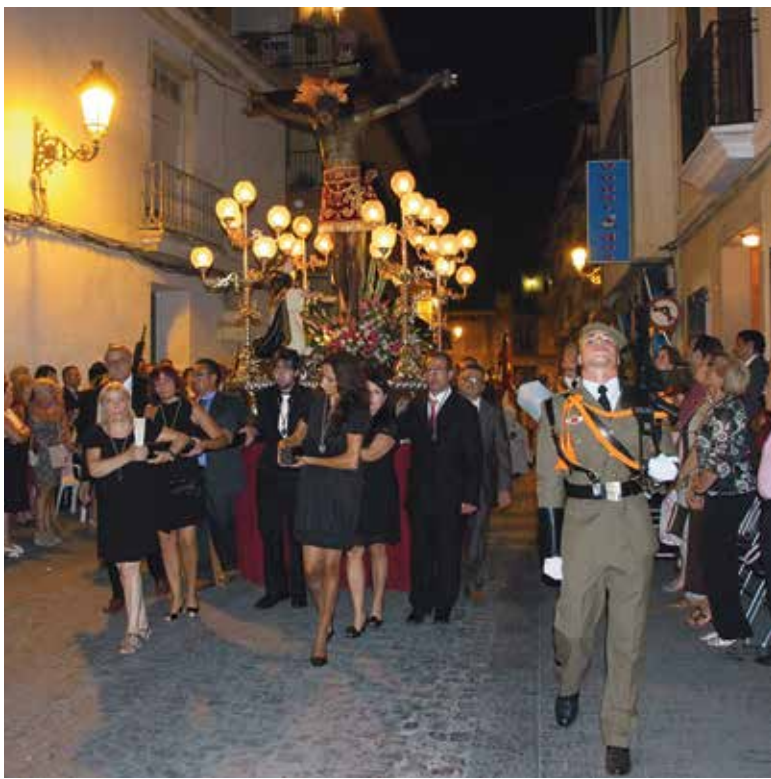
El Santísimo Cristo de la Fe a su paso por las calles de Paterna PAD