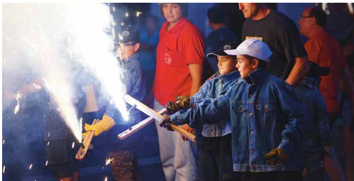
Instante del Pasacalle de Cohetes de Lujo Infantil