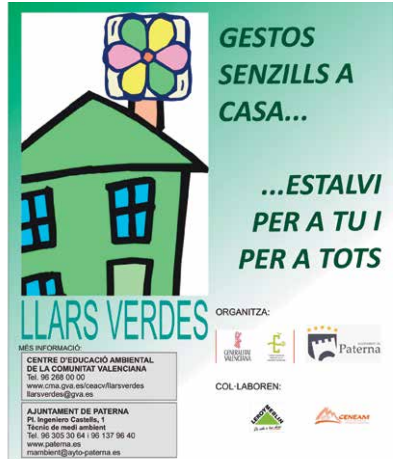
Imagen del cartel promocional

El plazo de inscripción comenzará el próximo 10 de septiembre, y permanecerá abierto a las familias hasta el día 19 de octubre. Para obtener tanto el folleto de inscripción como más información sobre el proyecto, se puede entrar en www.paterna.es y www.gma.cva.es/ceacv/llarsverdes .