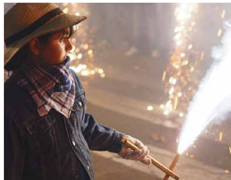
Un niño en el pasacalle de cohetes infantil