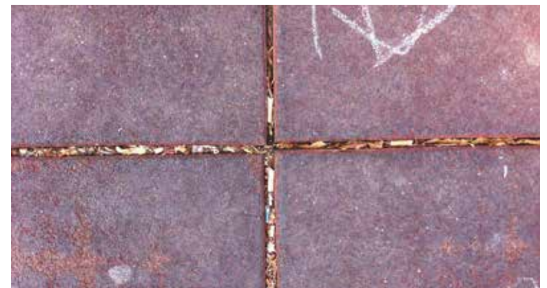
Imagen del suelo del Parque de La Cova Gran