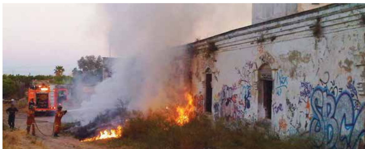
Imagen del incendio en el exterior del molino

La Asociación de Vecinos del Barrio de Campamento "espera mayor interés por parte de su Ayuntamiento, acudiendo a donde sean oídos y reciban el justo trato que Molí, vecindario y Paterna se merecen".