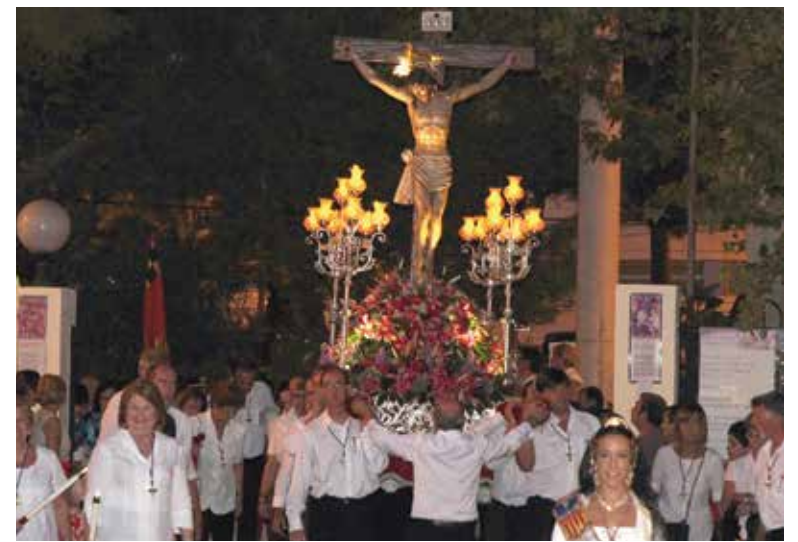
El Santísimo Cristo a la salida de la Iglesia