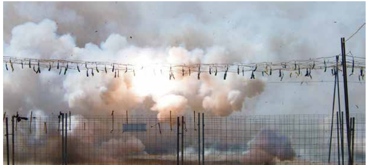
Masclètà en el Psrque Central