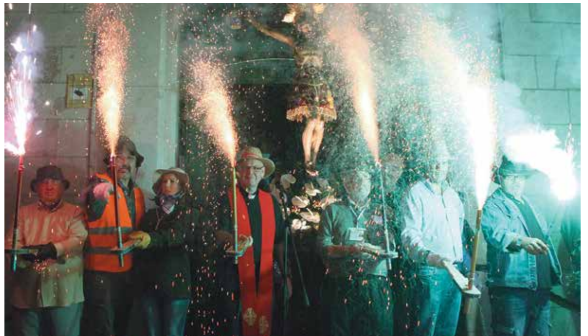
Imagen del Pasacalle de Cohetes de Lujo