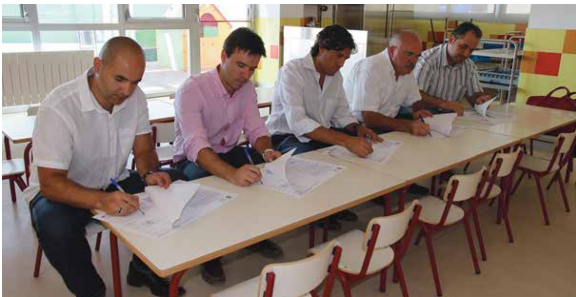
Alcalde, dirección de obra y representantes de la empresa constructora firman la recepción

Los socialistas de Paterna han denunciado la acumulación de suciedad y sedimentos en muchas de las alcantarillas del municipio y piden que, como medida preventiva para evitar posibles inundaciones de cara al otoño, se revise e intensifique las tareas de limpieza de los imbornales y de toda la red de alcantarillado municipal. Desde Aguas de Paterna, responsable de la limpieza de los imbornales, han indicado que "no sólo se ha limpiado las rejillas de las zonas más sensibles a la acumulación de agua, sino que se han realizado acciones preventivas para evitar en lo posible inundaciones".