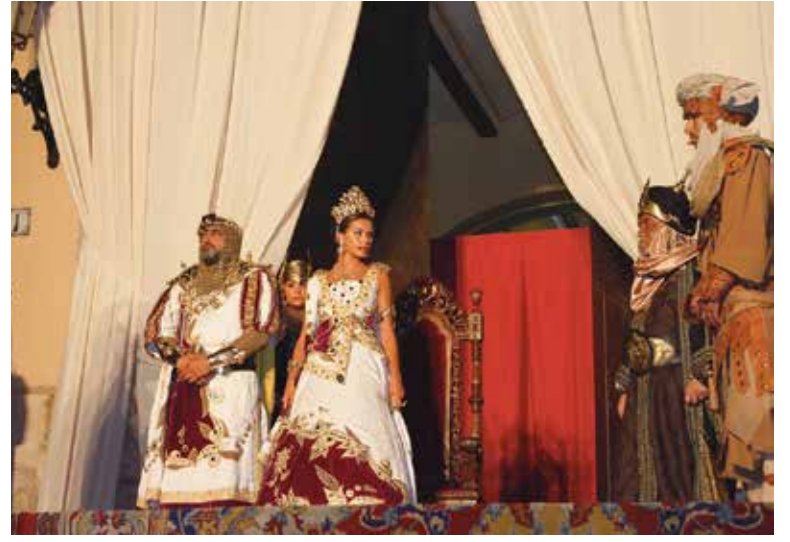
Entrega de Llaves al rey Jaime I