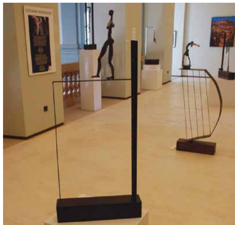
Imagen de la exposición

Según la organización la exposición ha tenido un gran éxito de público y crítica, habiendo recibido más de 5.000 visitantes.