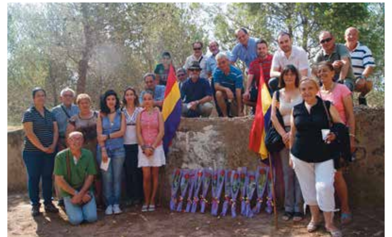
Los socialistas en el Paredón del España PAD

Durante el acto, los asistentes depositaron 13 rosas en el emblemático muro mientras se recitaba una poesía y dedicaron una palabra para conmemorar la valentía de esas mujeres que murieron por defender sus valores e ideales.