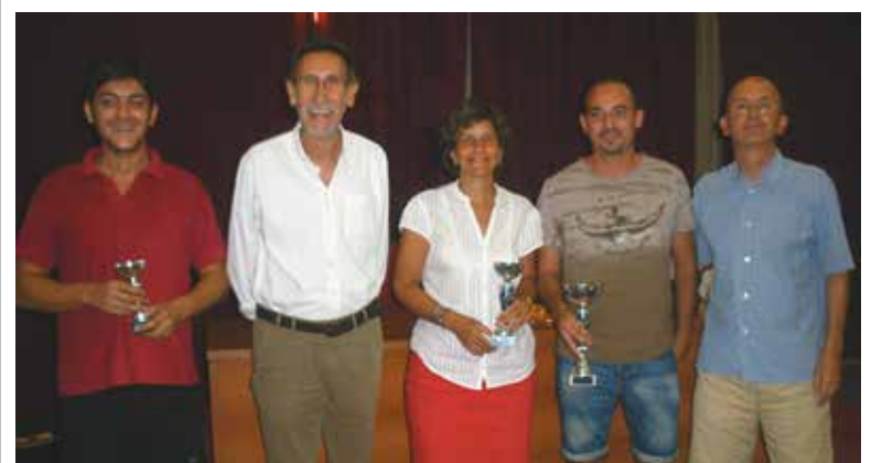
Imagen de los ganadores del Torneo