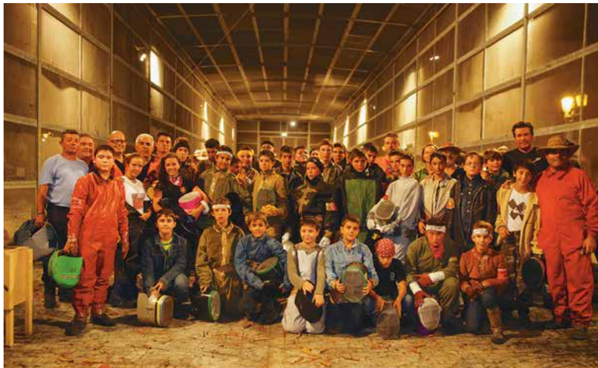
Participantes en la Cordà Infantil tras la celebración del acto

La pasión por el fuego en Paterna es una tradición que pasa de padres a hijos, así reza el himno de la Cordà, y así se demuestra con eventos como los celebrados durante estas Fiestas en las calles del casco urbano y en el coheteródromo. En el pasacalle de Cohetes de Lujo Infantil celebrado el pasado día 22 de agosto participaron cientos de menores que acompañados por sus padres recibieron todo tipo de consejos e instrucciones para aprender el uso de la pólvora sin riesgos. Se trata de artefactos pirotécnicos similares a los que se utilizan en el pasacalle de cohetes de lujo que antecede a la Cordà, aunque con una intensidad de fuego muy inferior. Este tipo de cohetes, denominados "de fuego frío", sirven para que niños de todas las edades se familiaricen con la pólvora de un modo seguro. Una chaqueta vaquera, guantes, un pañuelo y un gorro son los elementos comunes que portan los participantes del pasacalle de cohetes de lujo.