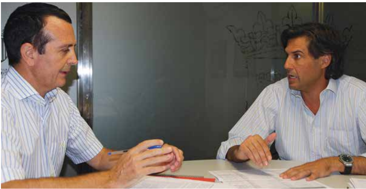
Palma y Agustí durante la reunión

El alcalde de Paterna, Lorenzo Agustí, indicó que las cuentas de 2013 se adaptarán al Plan de Ajuste presentado a raíz del Real Decreto Ley 4/2012, así como a las medidas que se derivan de la Ley Orgánica 2/2012 de Estabilidad Presupuestaria y Sostenibilidad Financiera. El primer edil añadió que "la prioridad es el mantenimiento de los servicios esenciales al ciudadano dentro de las posibilidades presupuestarias del consistorio, garantizando la sostenibilidad de la Administración Local".