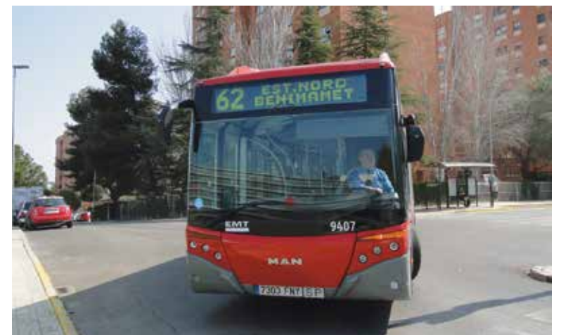
Línea 62 a su paso por Terramelar