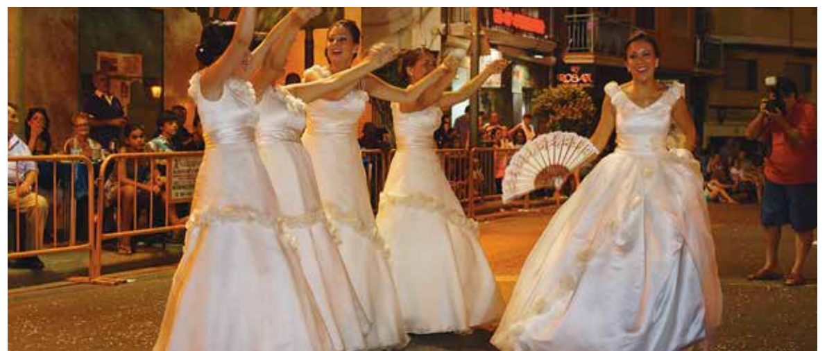
La Reina de las Fiestas baila junto a la Corte