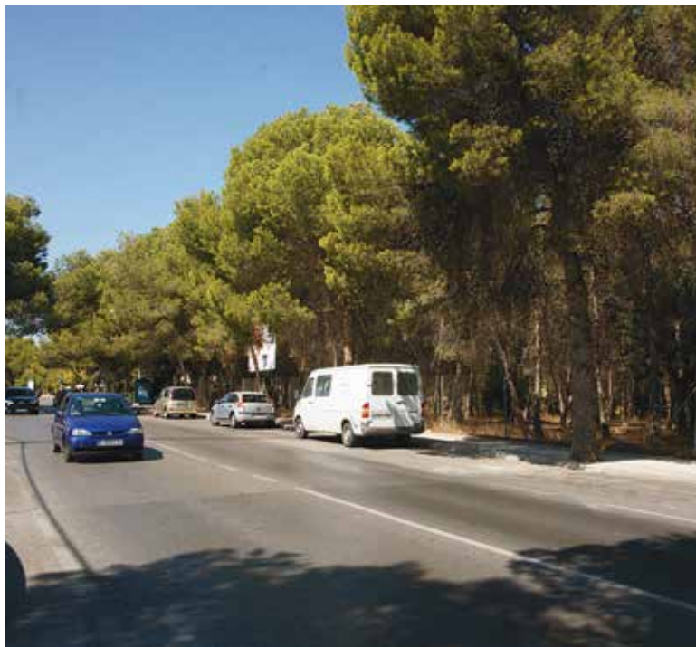
Imagen de la zona donde iría ubicado Consum

La parcela en cuestión es muy conocida entre los vecinos de la zona, pues además de contar con una pequeña pinada, alberga el esqueleto de un edificio de 4 plantas cuya construcción quedó paralizada hace más de tres décadas. Al parecer el proyecto de construcción de viviendas permitiría eliminar esta construcción, muy deteriorada por el paso de los años. Esta fue la considera-