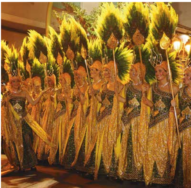
Gran Noche Mora