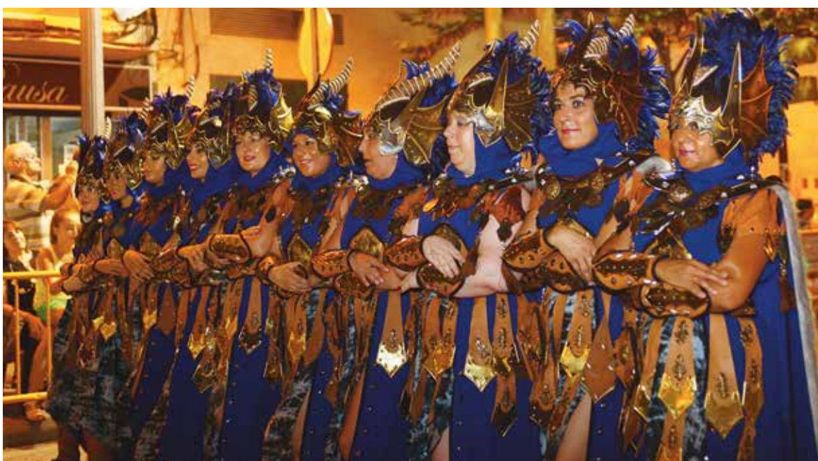
Guardianas de Sibila

A la conclusión del mismo se produjo el arriado de banderas Mora y Cristiana que ondeaban en el balcón principal del Ayuntamiento, que fueron entregadas a las comparsas Marakech y Templarios como sucesores de Alima y Guardianas de Sibila al frente de las Capitanías Mora y Cristiana.