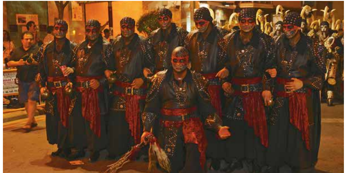
Instante de la Gran Noche Mora