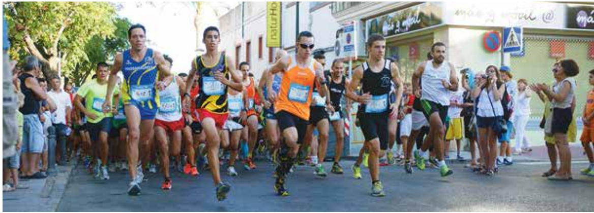
Imagen de la salida de la prueba de adultos