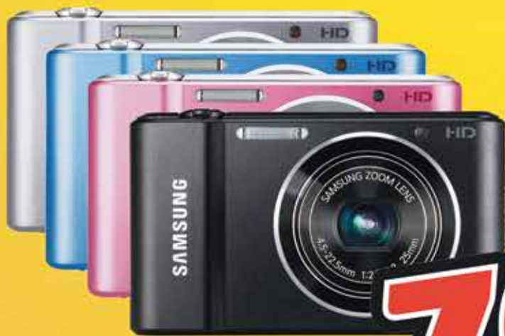
CÁMARA FOTOS DIGITAL SAMSUNG ST-66