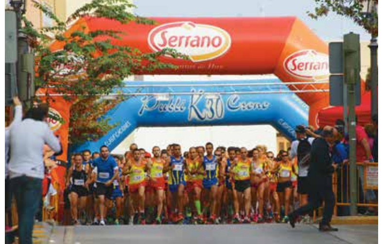
Instante de la salida del Gran Fondo