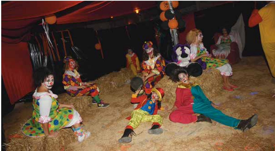
Uno de las escenas del Cohetódromo del Terror de 2011

Junto al cohetódromo fantasma se instalará un mercadillo