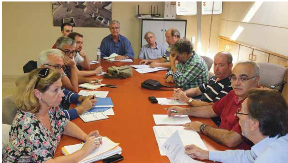
Imagen de la mesa de trabajo.

Agustí indicó a los vecinos que el documento propuesto "supone continuar en la línea de reducción de gastos emprendida en pasados ejercicios: completa la eliminación de las denominadas "competencias impropias", así como la minoración y supresión de gastos de tipo voluntarios, excluidas las de carácter social o asistencial de primera necesidad. En el apartado de Ingresos el alcalde indicó que "no se van a realizar modificaciones de tipos impositivos, proponiéndose una previsión inferior a la del ejercicio anterior en los ingresos que dependen de la construcción, a tenor del estancamiento del mercado inmobiliario". Por lo que respecta al capítulo de Gastos, Agustí indicó que "los 48 millones de euros presupuestados son los necesarios para atender los servicios esenciales y necesidades de mantenimiento que corresponden a un municipio como Paterna", recalzó. Como principales recortes, Agustí destacó la reducción de un millón de euros a través del nuevo modelo de gestión de los servicios deportivos, la disminución de 300.000 euros en consumo de energía a través de la nueva Empresa de Servicios Energéticos, la reducción de un millón de euros en Residuos Sólidos Urbanos, cerca de 400.000 a través del nuevo servicio de Gestión Tributaria y más de medio millón de euros de reducción de encomiendas a la empresa pública Gestión y Servicios de Paterna. "Además otros 70.000 euros se reducen de la partida de Fiestas que se añaden