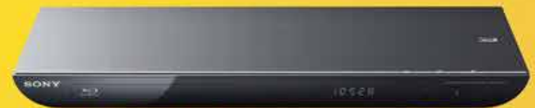
BLU-RAY 3D SONY BDPS490