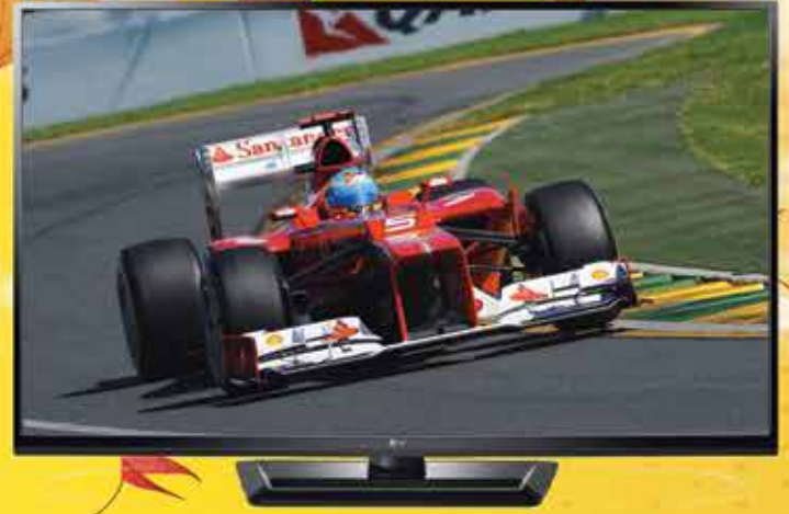
TV PLASMA LG 42" 42PA4500