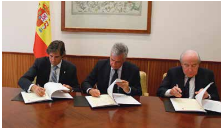
Instante de la firma del convenio

Según las condiciones del convenio, el Ministerio recibe en contraprestación a la referida cesión de zona verde su valor equivalente en unidades de aprovechamiento, correspondientes a 1231 m 2 de te-