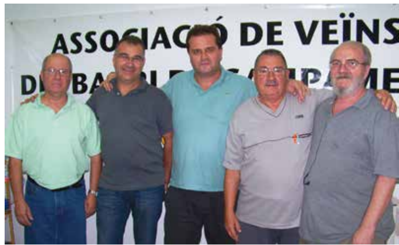
Miembros de la nueva directiva

Bajo esta dirección la entidad vecinal cumplirá ocho años de trabajo reivindicativo, vecinal y social en favor del barrio Campamento y de Paterna.