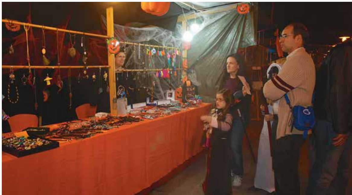
Uno de los puestos del mercadillo instalado el año pasado