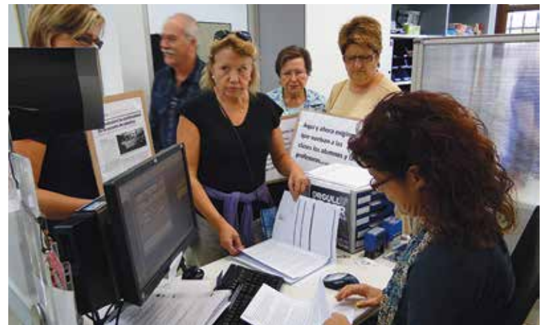
Instante de la entrega de firmas

El pasado 17 de octubre, alumnas de la escuela de adultos (EPA), presentaron en el registro de entrada del Ayuntamiento de Paterna más de mil firmas de apoyo a la reapertura de los centros de Santa Rita, La Coma y la Canyada. En el escrito, se insta al