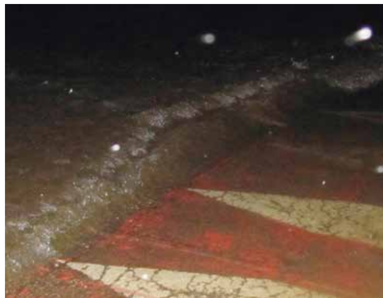
Los reductores de velocidad frenaron la evacuación de agua PAD

Desde el área de Infraestructuras del Ayuntamiento lamentaron los efectos provocados por las lluvias y recordaron que las obras de la calle 133 "no están finalizadas, por lo que exigiremos a la empresa responsable las actuaciones necesarias, para reparar aquello que no funcionó correctamente". Las mismas fuentes recordaron que el informe emitido por el gerente de Aguas de Paterna indicaba que "en general las infraestructuras para la evacuación de pluviales del municipio no funcionaron mal, simplemente no están diseñadas ni dimensionadas para una tormenta como la de ese día, con picos de 200 litros por metro cuadrado".