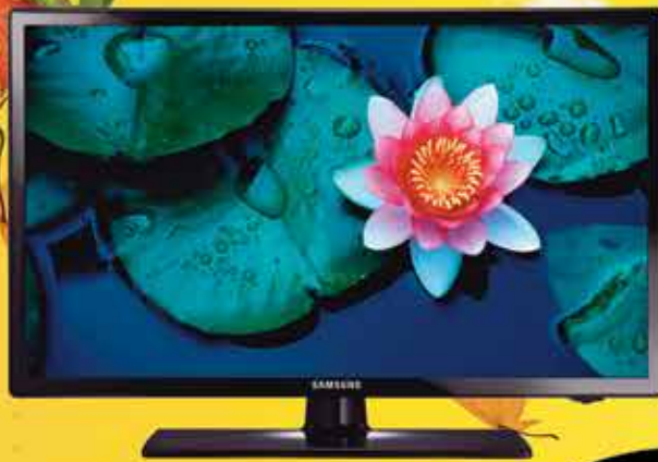
TV LED SAMSUNG 32" 32EH4000