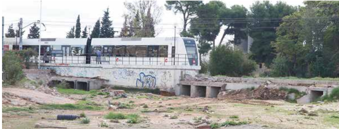
Lugar en el que se desbordó el agua del barranco que no pudo atravesar las vías