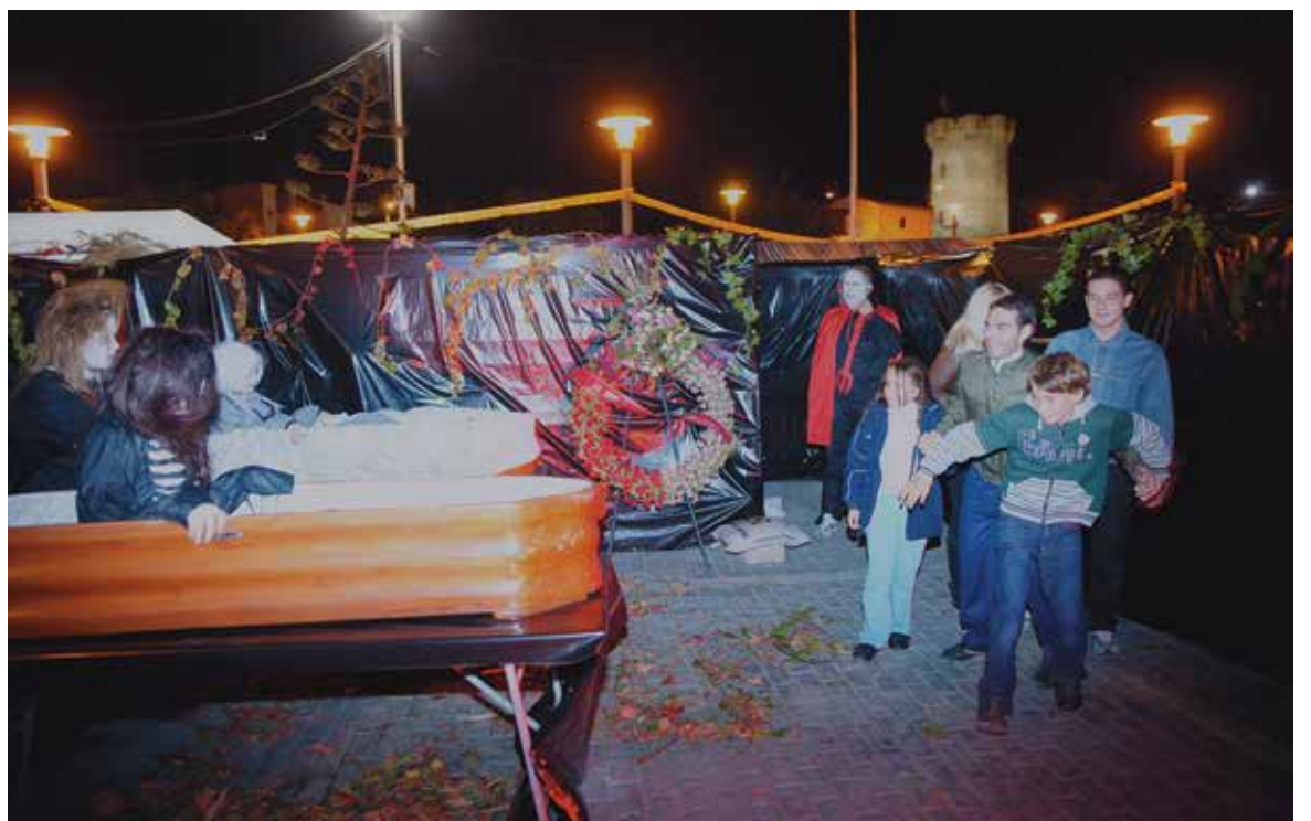
Una de las escenas del Coheteródromo Fantasma

Junto al Coheteródromo Fantasma del Terror, se montó un mercadillo, que permaneció también instalado durante el día 1 de noviembre, Día de Todos los Santos, y en el que los visitantes pudieron encontrar productos esotéricos, golosinas y distintos productos artesanales.