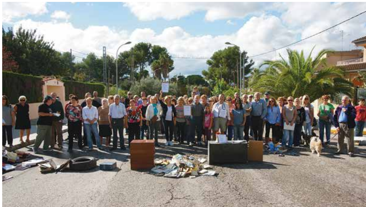
Los vecinos cortaron la calle con objetos dañados por las inundaciones

A la manifestación se unieron algunos vecinos de la calle 133, que trataron de explicar a los veci-