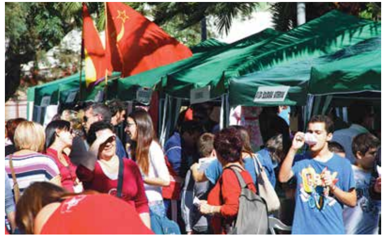
Multitud de vecinos se acercaron al Mercado de Asociaciones