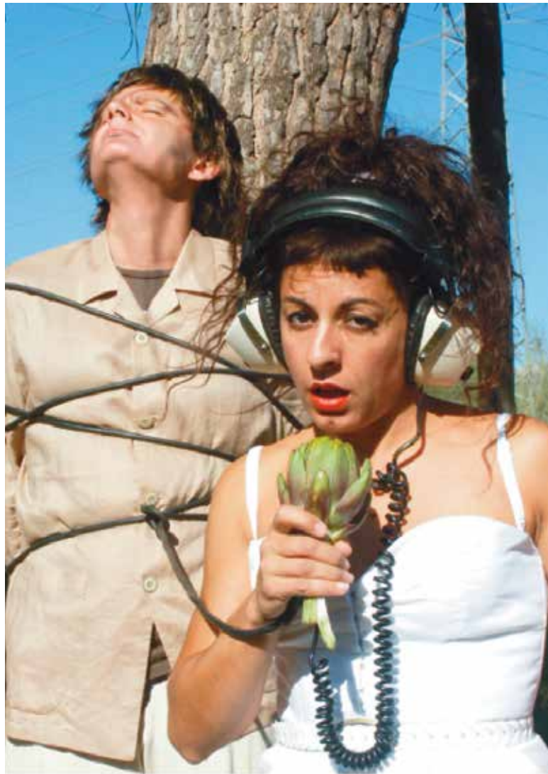
Cristina Medina en foto promocional de la obra