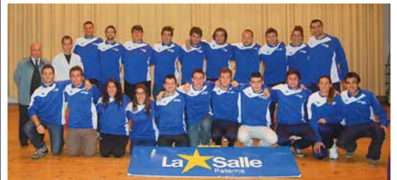
Foto de grupo de los entrenadores del club