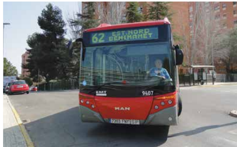
La línea 62 a su paso por Terramelar