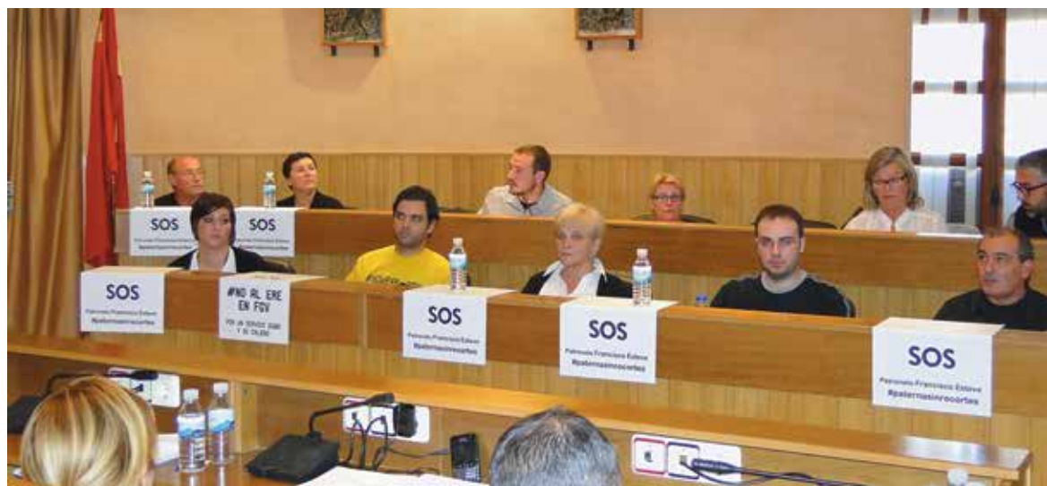
Los concejales socialistas mostraron carteles de apoyo al Patronato Francisco Esteve

Por lo que respecta a las Inversiones, "se utilizarán para pagar las expropiaciones que se deben y prever actuaciones por las lluvias acontecidas el pasado septiembre", indicaron. "En líneas generales el presupuesto de 2012 asegura mantener los servicios esenciales y básicos para el ciudadano en estos momentos de gran incertidumbre, reduciendo tanto los ingresos como los gastos adecuándonos a la realidad socioeconómica que vivimos", apuntó el primer edil.