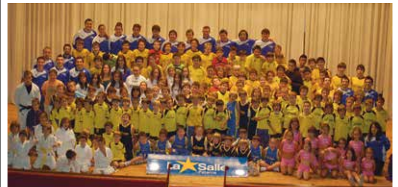
Imagen de grupo del Club Deportivo La Salle