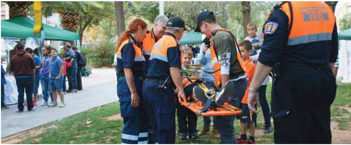
Miembros de Protección Civil haciendo una demostración