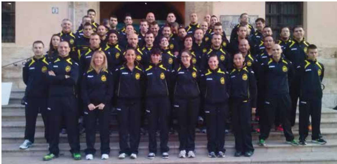
Miembros del club posan a las puertas del Ayuntamiento

El club combina, como se vio en su presentación, deporte con religión ya que La Salle es un centro de índole religiosa.