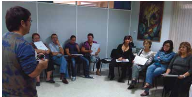
Imagen del curso para cuidadores celebrado en el Espai d'Igualtat PAD

El curso cumple los requisitos establecidos desde la Dirección General de Autonomía Personal y Dependencia, y los contenidos del mismo están recogidos en el documento Marco de Acción para desarrollo de cursos de formación para cuidadores no profesionales desde los Servicios Municipales de Atención a la Dependencia. El Servicio Municipal de Atención a la Dependencia del Ayuntamiento de Paterna es el primero que imparte este tipo de cursos en toda la Comunidad Valenciana acreditado y validado por la Conselleria dentro de dicho Marco de Acción.