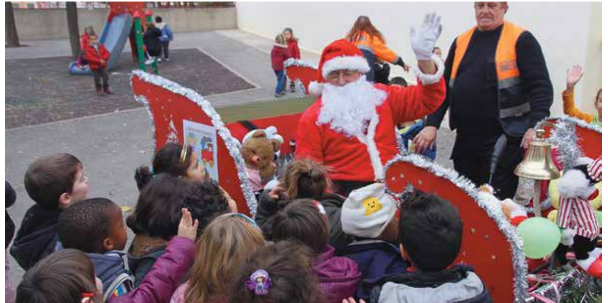
Papá Noel difundiendo la Campaña en el Colegio Ausias March

solidarios y altruistas con otros niños necesitados”. Por este motivo se solicita que los juguetes estén en buen estado de conservación, a ser posible que no sean eléctricos, y mejor que sean juguetes educativos que contribuyan a estimular cualquier aspecto del desarrollo infantil. Como lugares establecidos para la entrega de juguetes se han habilitado espacios en los centros municipales de La Canyada, Terramelar, Valterna y La Coma, así como el centro polivalente Valentín Hernández de Santa Rita y el centro de Servicios Sociales ubicado de la Plaza del Pueblo en el casco urbano. También están colaborando las Asociaciones de los Polígonos Empresariales en cuyas sedes se pueden depositar los mismos.