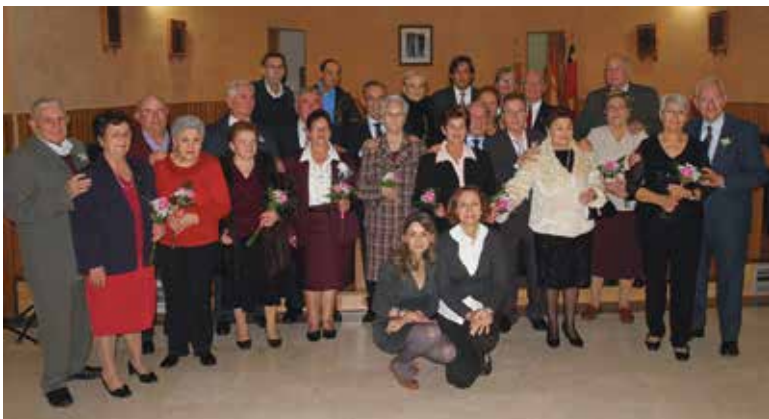
Las parejas homenajeadas junto a los representantes municipales PAD

A la conclusión del acto, el alcalde, Lorenzo Agustí, les dedicó unas palabras a través de las cuales quiso mostrar "el enorme agradecimiento que todos debemos a una generación que sufrió mucho en tiempos aún más difíciles que los actuales y que lo dio todo por ofrecernos un futuro mejor".