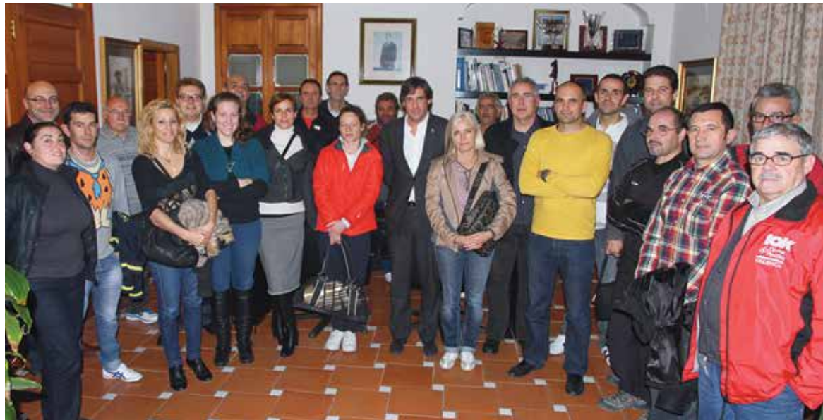
Representantes de las entidades locales junto al alcalde y el concejal de Deportes

En virtud de dichos convenios el Ayuntamiento de Paterna, a través de los Servicios Deportivos Municipales, se compromete a apoyar el mantenimiento de programas deportivos relacionados con las actividades de cada entidad, albergándolos en las instalaciones municipales en función