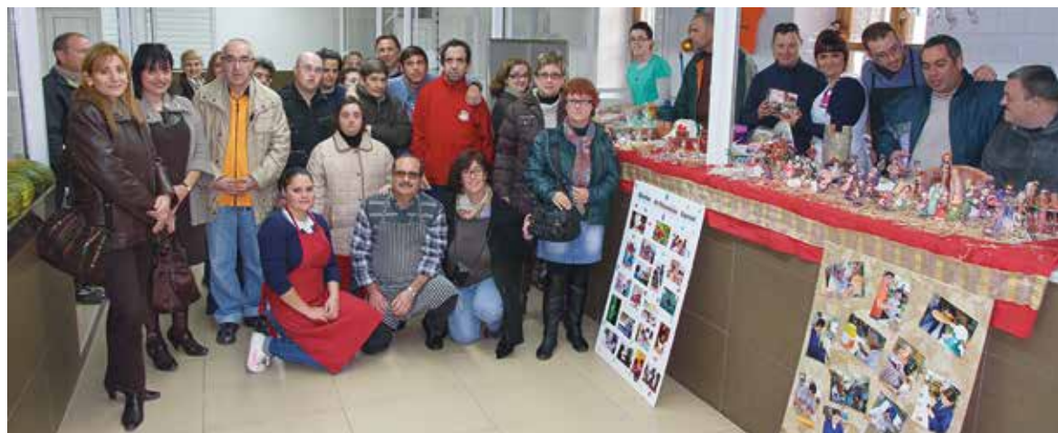
Imagen del puesto ubicado en el Mercado Municipal