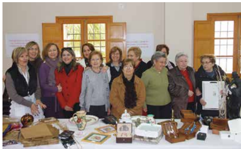
Imagen del mercadillo solidario

Respondiendo a la misma necesidad social desde el ámbito ciudadano, el Centro Parroquial de San Pedro acogió un mercadillo solidario a beneficio de Cáritas Parroquial. La iniciativa surgió de un grupo de mujeres usuarias de los diversos talleres de pintura y manualidades que se desarrollan en el mismo local, que decidieron donar los productos elaborados durante buena parte del año para recaudar dinero. Además han recibido donaciones de productos procedentes de diversos comercios que han colaborado de modo desinteresado.