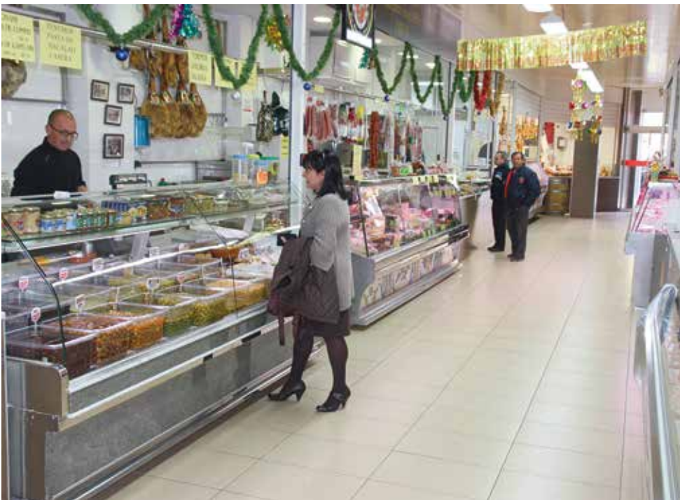
Aspecto actual del interior del Mercado Municipal