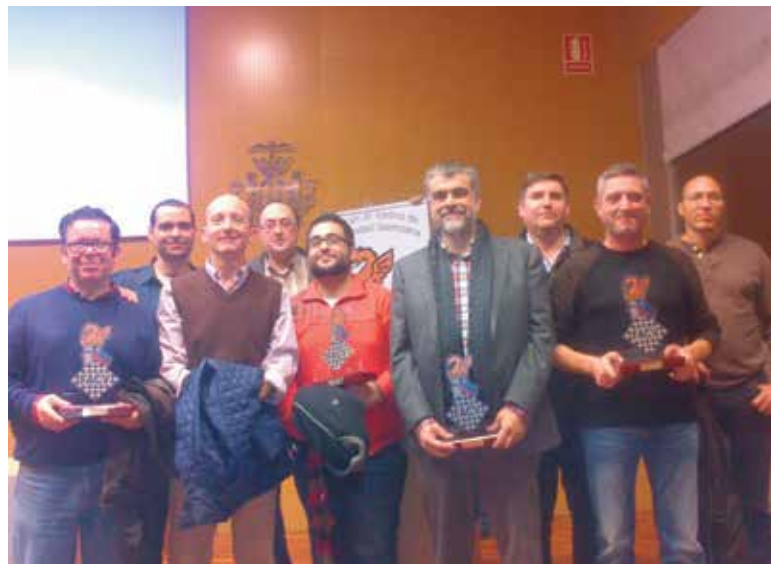
Miembros del club junto a su patrocinador