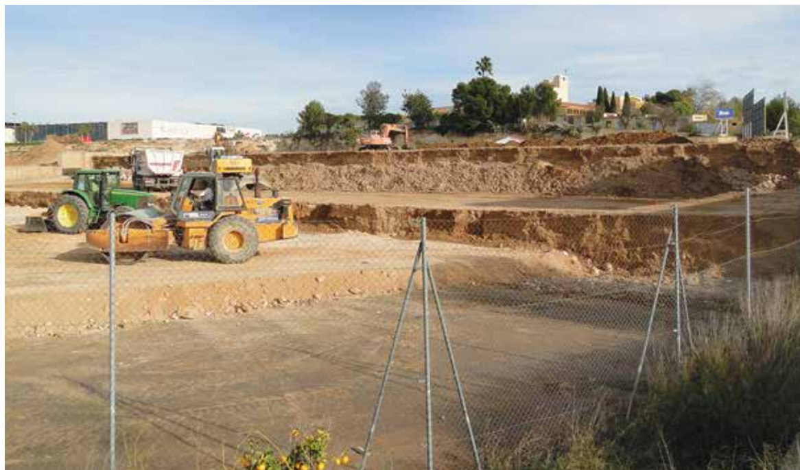
Imagen de las obras