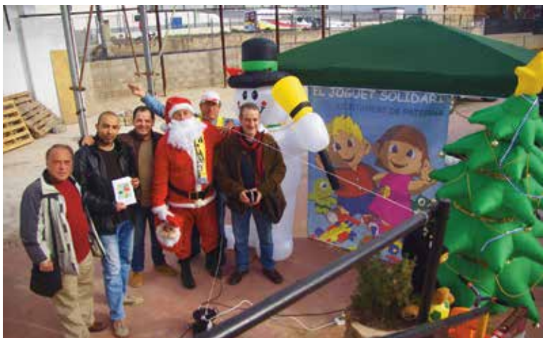
Carpa situada en la entrada del estadio Gerardo Salvador

navideñas. La carpa instalada para la ocasión recibió decenas de juguetes que servirán para hacer más alegres las fiestas navideñas a los niños de Paterna que más lo necesitan. Durante el encuentro también se celebró una rifa para recaudar fondos, y hasta el próximo día 22 Papá Noel seguirá visitando los centros educativos del municipio para recoger juguetes y difundir esta campaña solidaria. Además, hasta el día 26, todo aquel que lo desee podrá entregar regalos en los centros sociales de la Canyada, Terramelar, Lloma Llarga y la Coma, así como en el Centro Polivalente Valentín Hernaez.