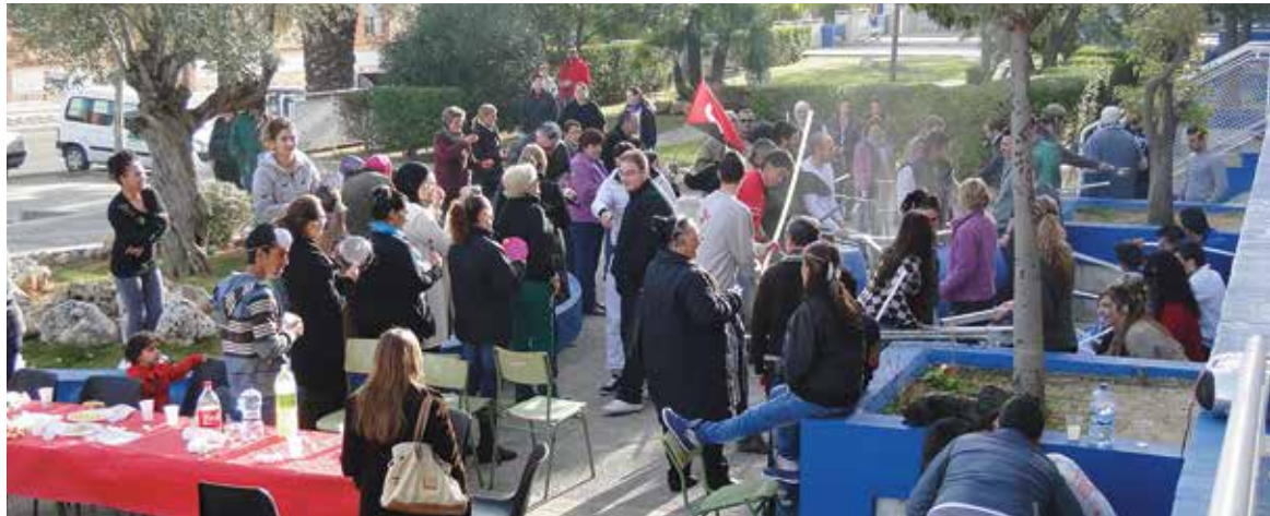
Imagen de la cacerolada en el barrio de La Coma

Desde la AAVV denuncian la existencia de “más de 200 viviendas vacías en el barrio, fincas totalmente deshabitadas y destrozadas”. Como solución la AVV llama la ciudadanía de La Coma a “iniciar una campaña de movilizaciones con carácter permanente para defender el Plan de normalización La Coma 2013, así como un nuevo acuerdo urgente y especial