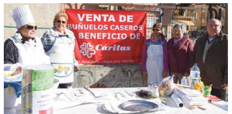
Puesto de buñuelos en La Canyada

que demuestra lo concienciados que están muchos vecinos a la hora de ayudar a las familias más desfavorecidas. En este sentido también es muy destacable que un vecino anónimo efectuó recientemente una compra solidaria por importe de 1.204 euros a beneficio de las familias que acuden a Cáritas La Canyada. A través de esa compra se hizo acopio de muchos kilos y litros alimentos de primera necesidad como leche, aceite, galletas, tomate y azúcar que serán entregados en las próximas semanas a estas familias.