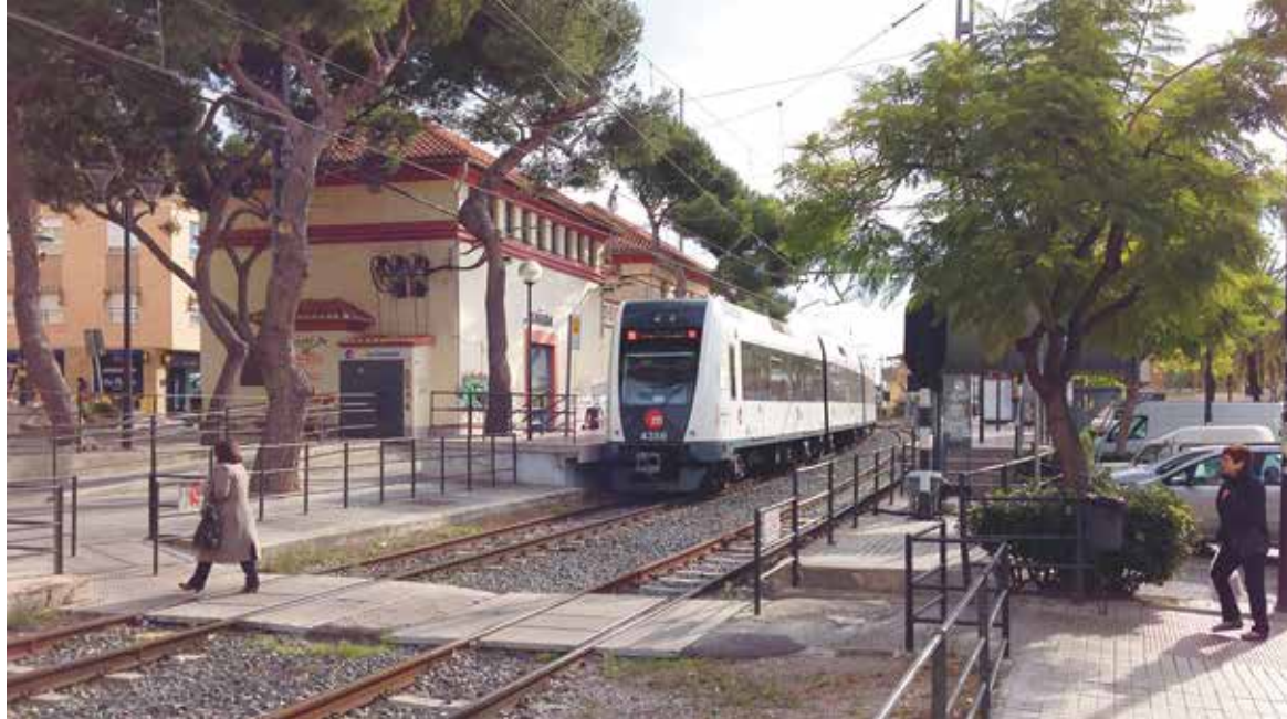
El metro a su paso por la estación de La Canyada

La duplicidad de líneas de autobús “se podría simplificar modificando el itinerario para dar servicio al Plantío y la Canyada, y conectarlos con Valencia. Y, mientras se estudia esta opción, se podía implementar automá-