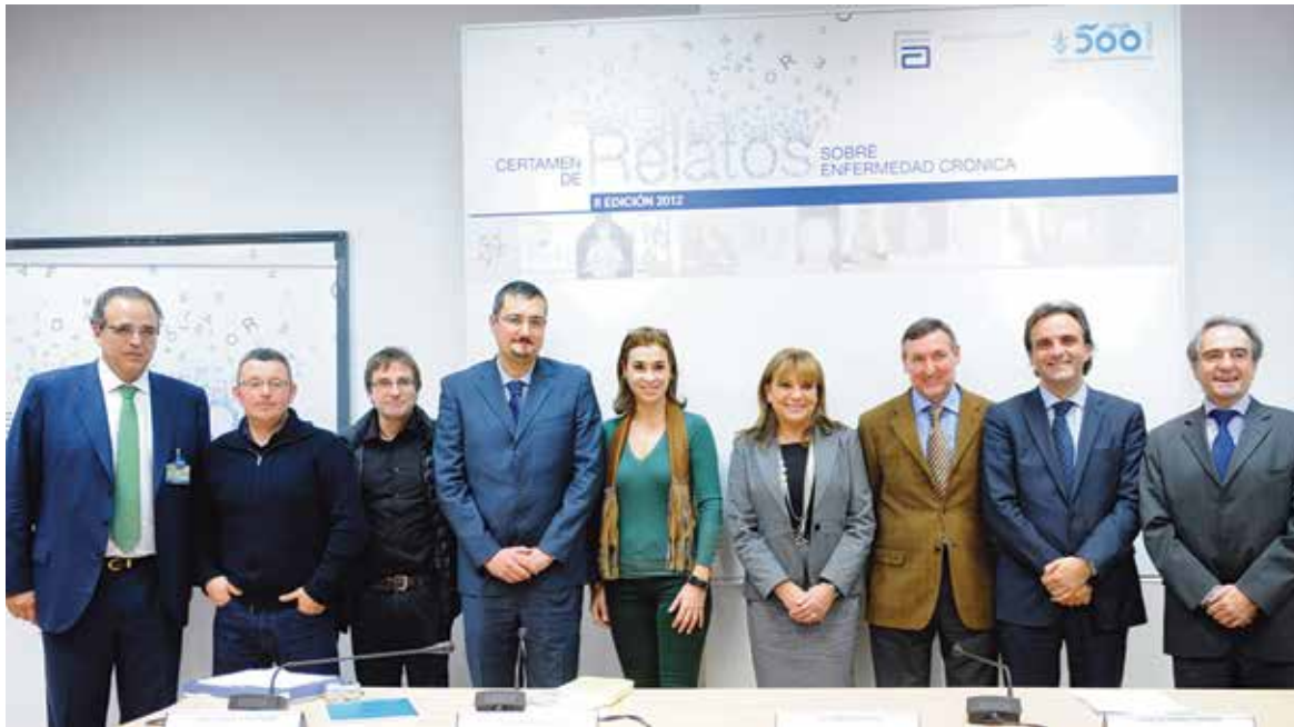
Imagen de los premiados

En la Comunitat Valenciana residen más de 148.000 pacientes que reciben más de 10 tratamientos diferentes y cerca de 1.700 reciben hasta 20 tratamientos.