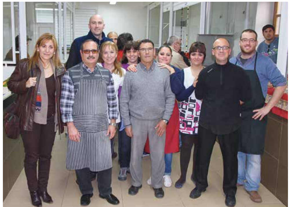
PAD Representantes municipales junto a comerciantes del Mercado Municipal