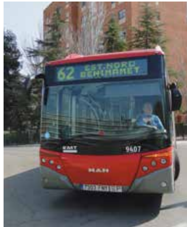
Línea 62 a su paso por Terramelar