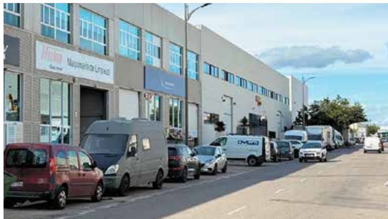
Imagen de una zona industrial del municipio

“Un balance muy positivo”, en palabras del Alcalde de Paterna, Juan Antonio Sagredo, quien ha subrayado que “en Paterna seguimos liderando la creación de empleo en la provincia y en la Comunitat Valenciana, a pesar de nuestro constante crecimiento poblacional por el aumento de residentes que eligen nuestra ciudad para vivir, estudiar, trabajar y ser felices”.