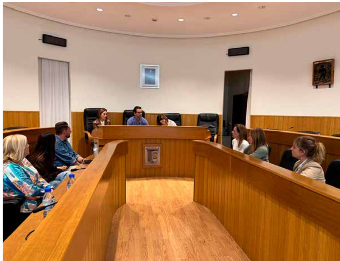
Instante de la Junta de Gobierno Local donde se iniciaron los trámites para la salida de la EMTRE

A este incremento se suma la derrama extraordinaria de 13 millones de euros aprobada por la EMTRE en junio, de la que a Paterna se le exigen más de 1,3 millones, una cantidad que el Ayuntamiento ha recurrido al considerarla “injusta y desproporcionada”. Sagredo recordó además los “antecedentes de