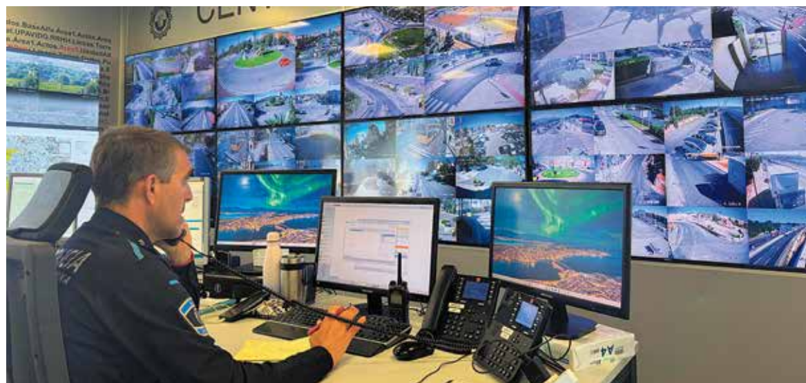
Centro de control de la Policía Local de Paterna

Además, se dotará a la Policía Local de nuevos equipos tecnológicos, entre ellos drones, etilómetros, dispositivos portátiles de detección