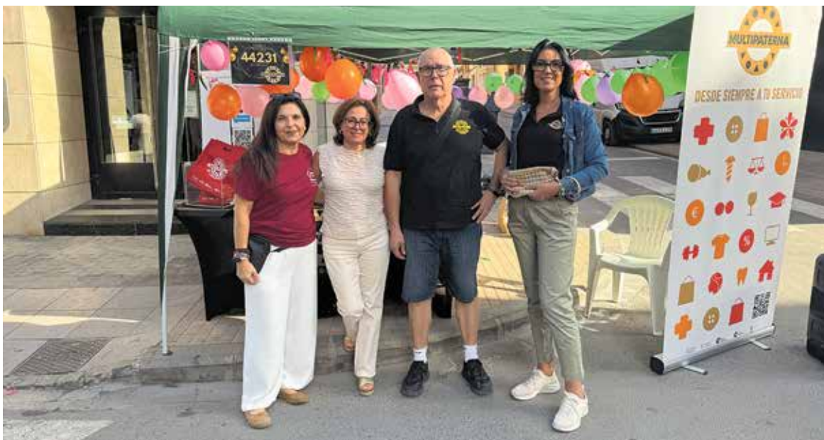
Miembros de la directiva de Multipaterna en la carpa instalada en la calle Mayor

Desde la asociación animan a los vecinos a seguir la actualidad y novedades de la entidad a través de sus perfiles oficiales de Facebook e Instagram, así como en su web multipaterna.com, donde podrán encontrar información de todas las campañas, sorteos y promociones activas.