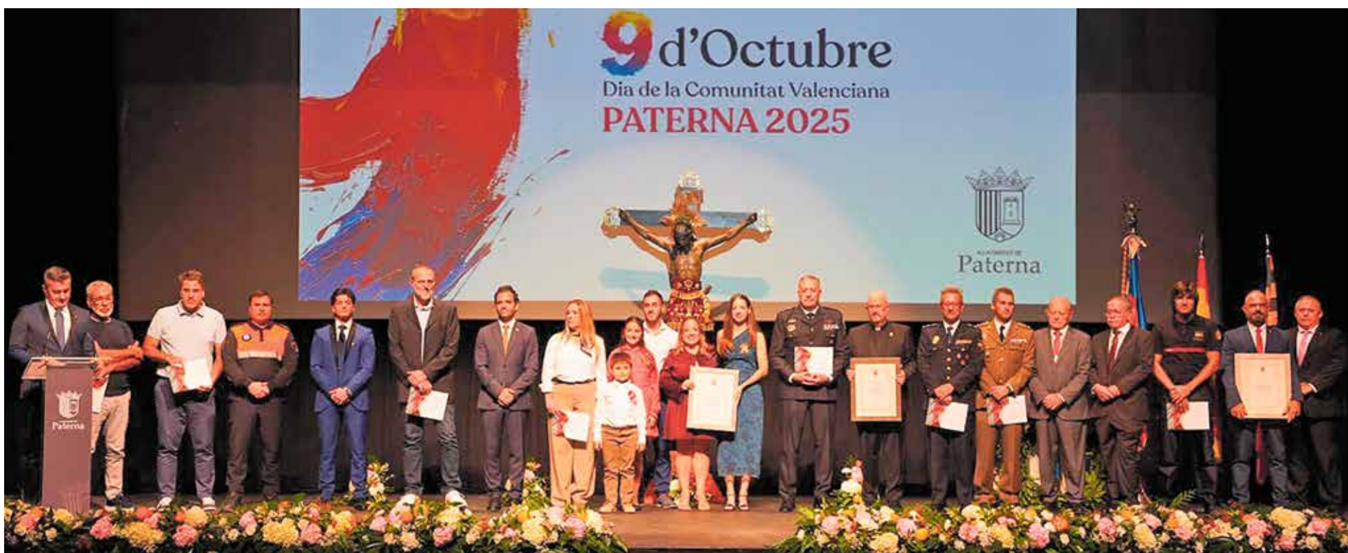
Foto de familia de los galardonados durante los actos conmemorativos de la festividad del 9 de Octubre