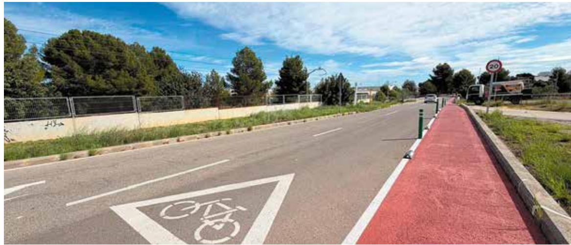
Vista de una vía y carril bici en el barrio de La Canyada

Entre las intervenciones más destacadas se encuentra la renovación de la calle 29, con la mejora de rotondas, pavimento