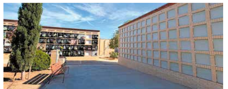
Nuevos nichos del Cementerio Municipal