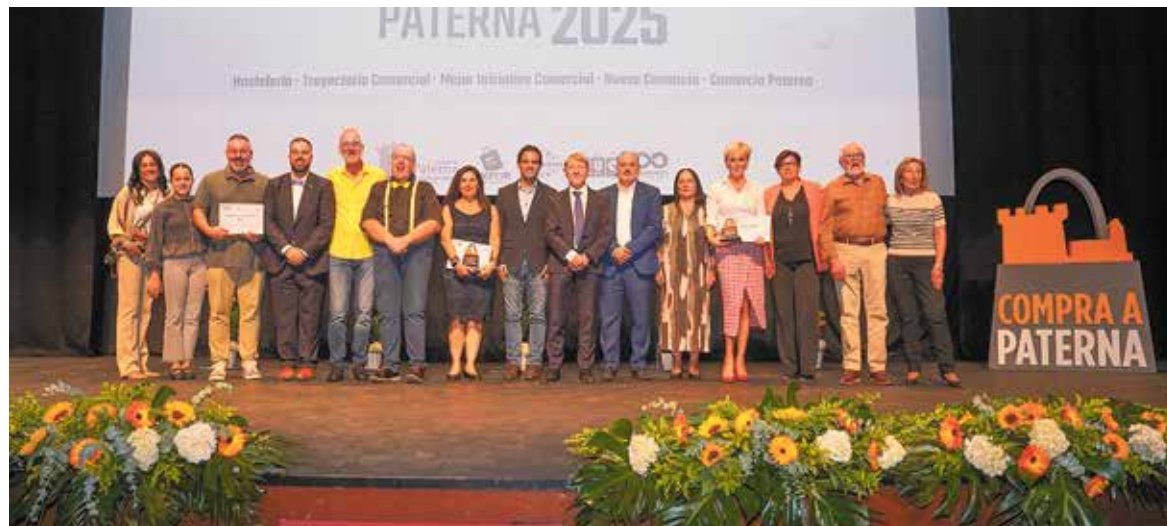
Foto de familia de los galardonados en la Gala de Premios del Comercio 2025