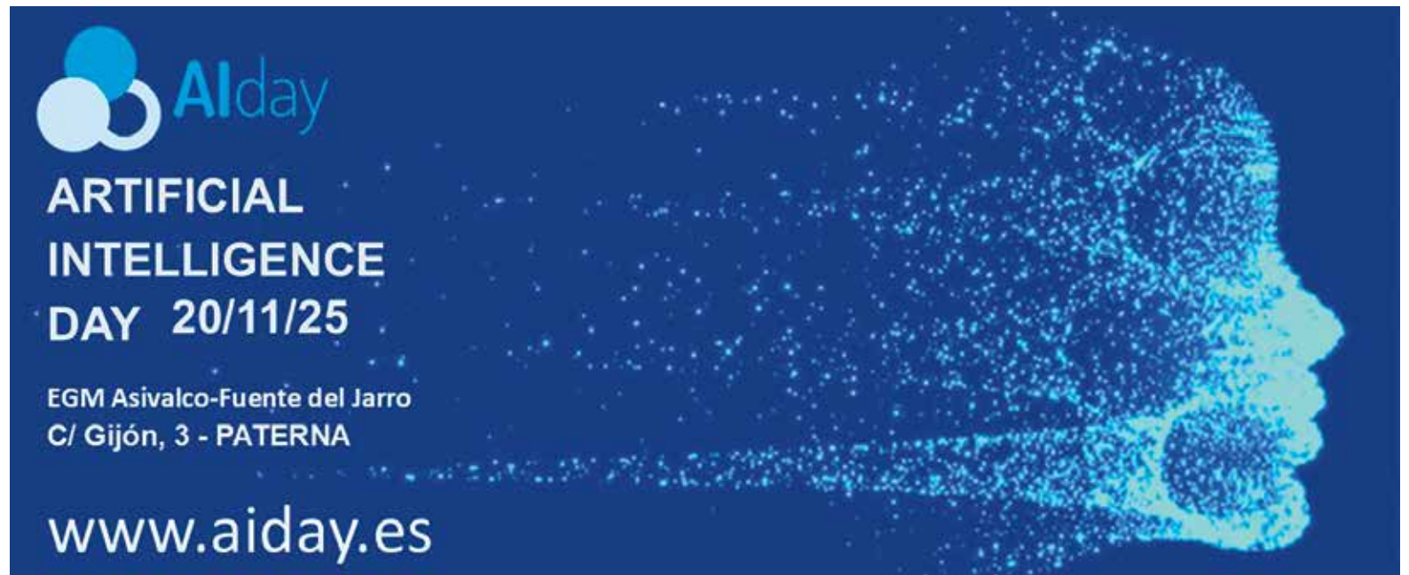
Cartel promocional del evento

La jornada, “permitirá a los asistentes conocer de primera mano casos de éxito de cómo la Inteligencia Artificial y la ciberseguridad puede ayudar en la gestión de las empresas”, declara la dirección de TICforyou, organizadora del evento. Durante la sesión, expertos y profesionales de entidades de la talla de Quantumsec, Esfera, Tabulación, LupaSafe, Erobots, Cátedra Innovación UPV, entre otros, expondrán de forma práctica casos