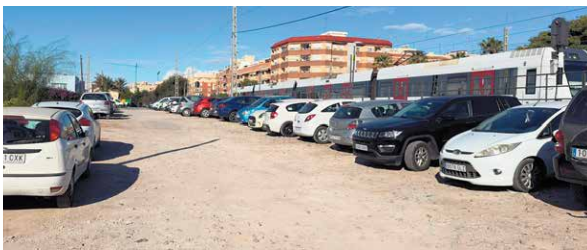
Espacio junto a la estación de metro que se habilitará como parking

Asimismo, ha señalado que “seguimos trabajando para dar soluciones reales a los problemas de aparcamiento que tienen la mayoría de ciudades y para que Paterna siga siendo un lugar más cómodo y agradable para vivir”.