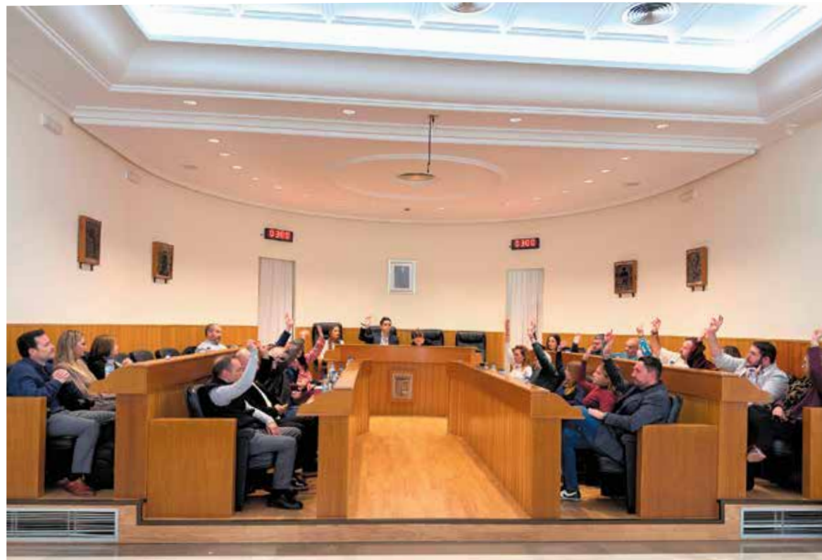
Instante de la votación de la modificación de la ordenanza de la Tasa Europea de Residuos

Cabe recordar que en la ciudad de Paterna, la Eurotasa se calcula en función de los metros cúbicos de agua consumida el año anterior, “una fórmula que mejora de manera eficiente y a