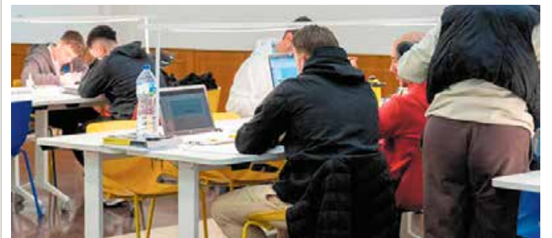
Estudiantes en el centro municipal Arcoiris