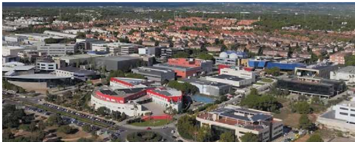
Vista aérea del Parque Tecnológico de Paterna

Este liderazgo en la contratación está impulsado especialmente por el sector industrial, que concentra el 38% de los contratos, en coherencia con el potente tejido empresarial de Paterna, sus seis áreas empresariales y su reconocimiento como Primer Municipio Industrial Estratégico.