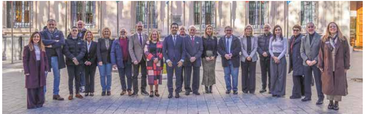
Representación del tejido festivo-cultural de Paterna en el Senado