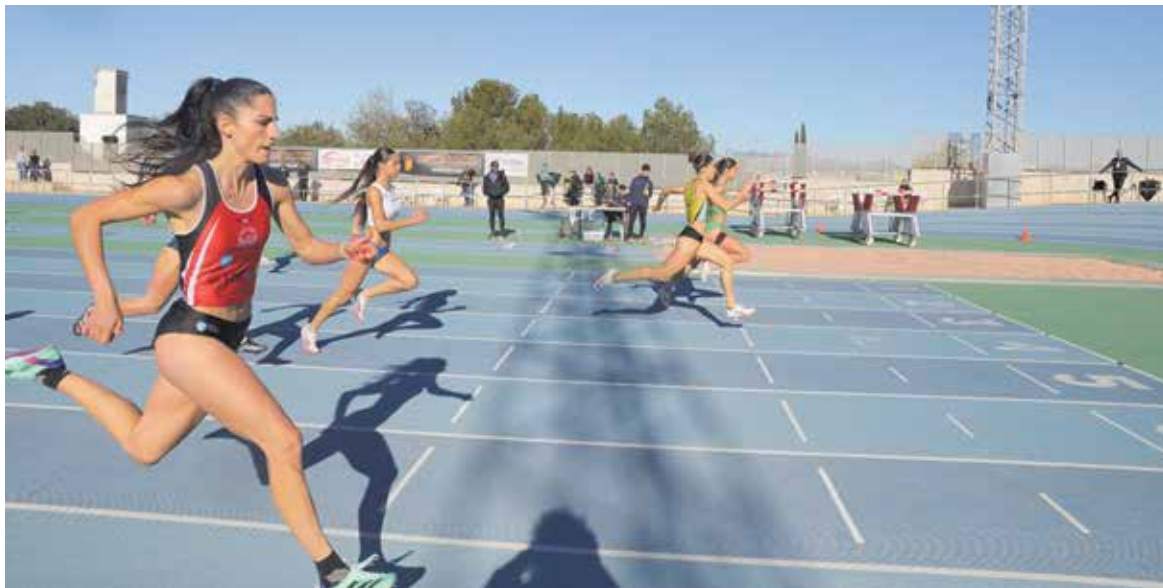
Atletas compitiendo en la pista de atletismo municipal

Este refuerzo permitirá llegar a más familias, ampliar las ayudas a deportistas individuales y consolidar el apoyo al tejido deportivo del municipio, manteniendo los convenios con los clubes locales y garantizando que puedan seguir desarrollando su actividad en condiciones