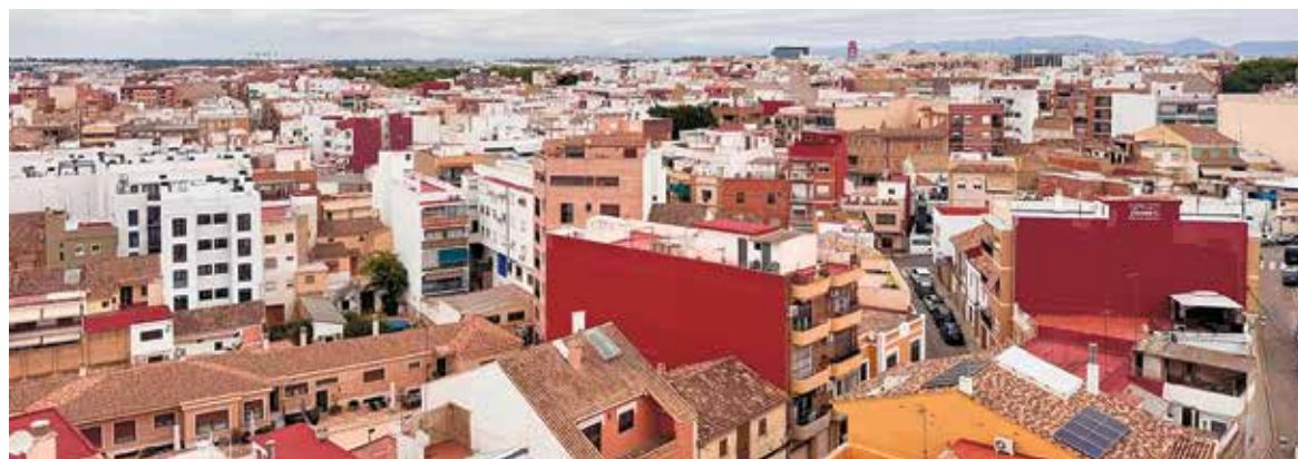
Imagen de viviendas en Paterna

Sagredo ha remarcado la importancia de actuar rápidamente ante la situación actual y ha precisado que “si no hacemos nada, el precio de la vivienda seguirá subiendo y eso limitará el futuro de muchas familias. Necesitamos herramientas que nos permitan garantizar alquileres más justos y facilitar que la gente pueda vivir y desarrollarse en Paterna”.