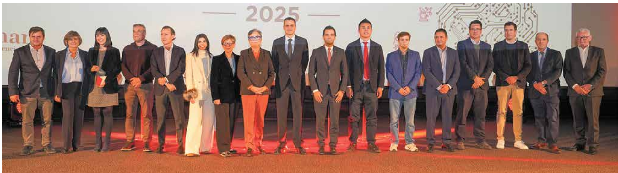
Foto de familia de los galardonados en la X edición de los Premios Paterna Ciudad de Empresas celebrada en Kinopolis

Con esta nueva edición de los premios, Paterna consolida una vez más su posición como uno de los principales motores económicos de la Comunitat Valenciana, reafirmando su apuesta por la innovación, el emprendimiento y el crecimiento sostenible.